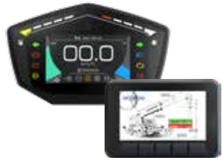
CRUSCOTTI E DISPLAY