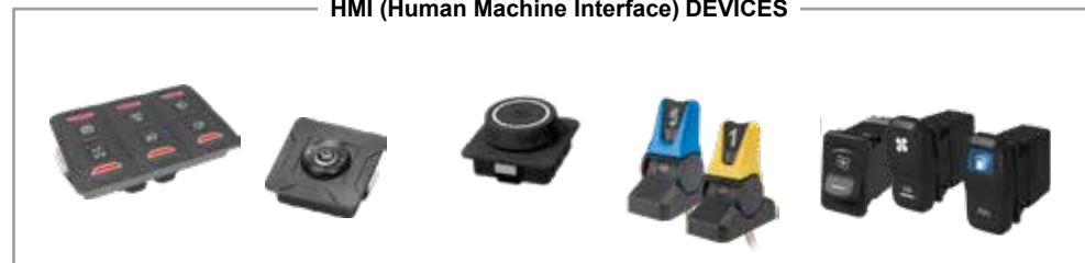
HMI (Human Machine Interface) DEVICES