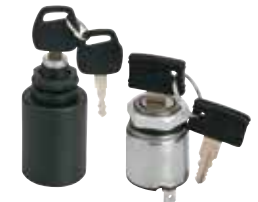
COMMUTATORI A CHIAVE